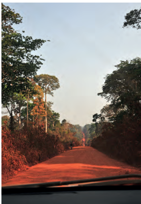
Straße in Kamerun

Deine Wege mögen dich aufwärts führen, freundliches Wetter begleite deinen Schritt.