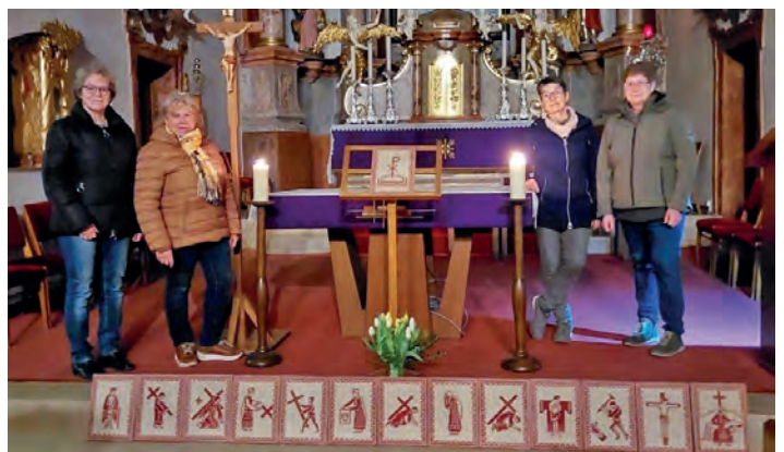
Kreuzwegandacht um 18.00 Uhr in der Kirche (Foto aus 2023)